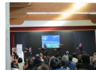
(11/28 発表会) 沢山の拍手をありがとうございました。