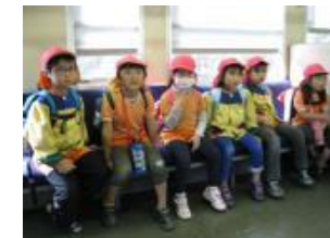
ディーゼルカーに乗りました